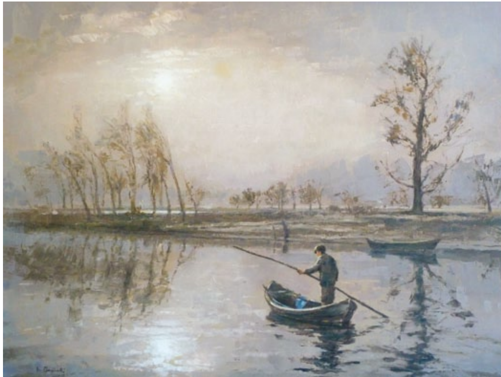
Barcaiolo sul Po figurativo a spatola