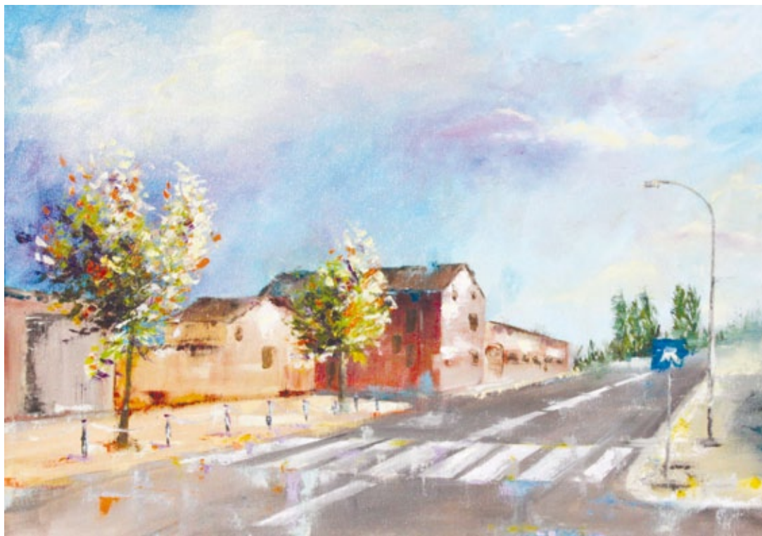
Mattina a Rivarolo olio su tela