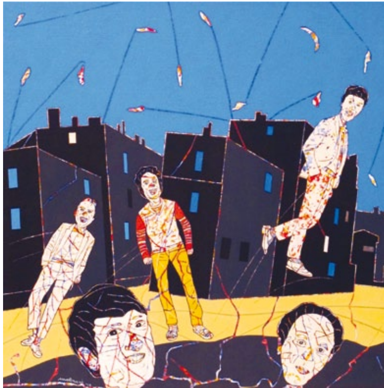
Passeggiata a Rivarolo acrilico su tela