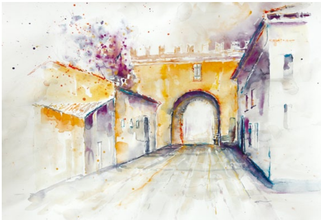
Porta Mantova acquerello