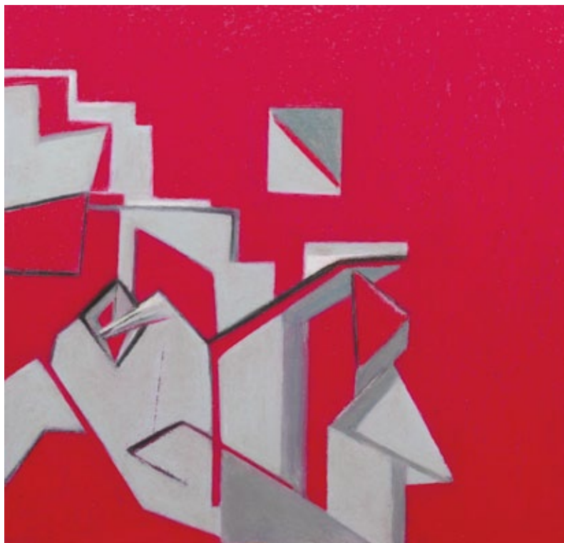
Pittogramma pastello a olio su carta