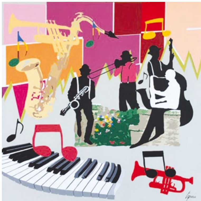
Big Bands acrilico su tela