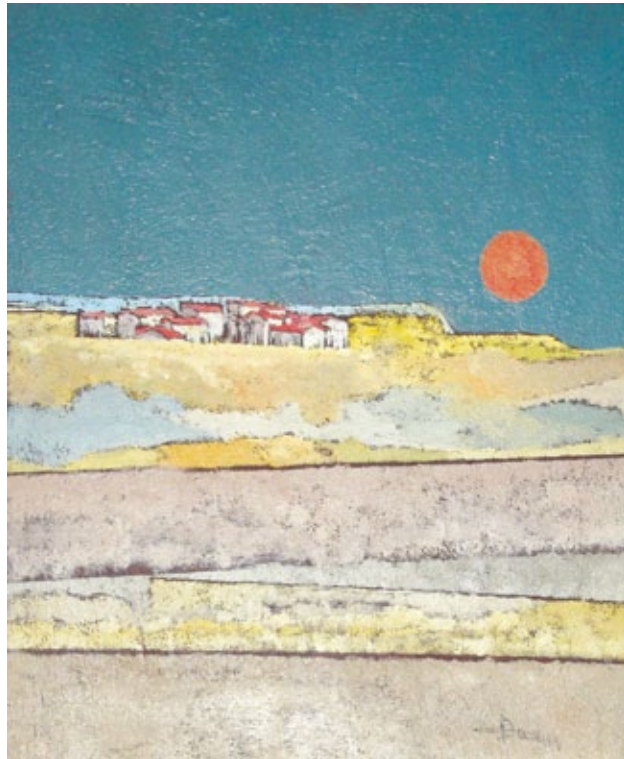
Fermo immagine olio su tela