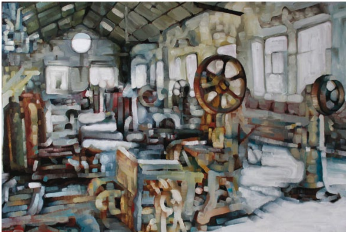
Neglected # 7 olio su tela

Motivazioni: Di straordinario impatto la scelta di rappresentare un interno di officina privo di figure, illuminato dall'esterno, ma soprattutto con una proposizione cromatica che tende allo sfocamento. Si ottiene così nel vuoto dell'assenza il sentore silente del lavoro, e insieme con il velo della distorsione ottica un salutare dubbio: la realtà esiste solo quando si cerca di rappresentarla.