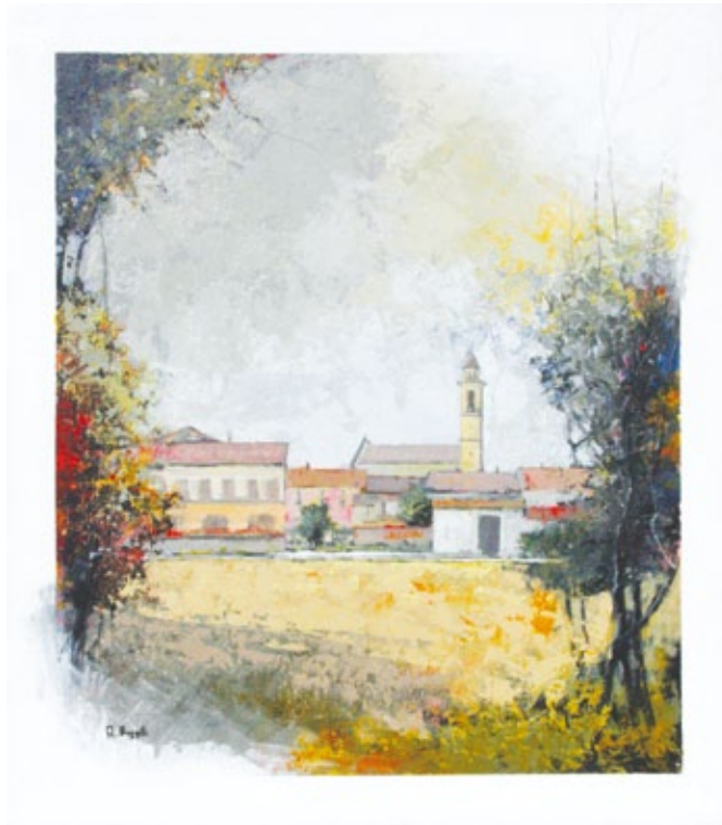
Veduta di Rivarolo tecnica mista su tela