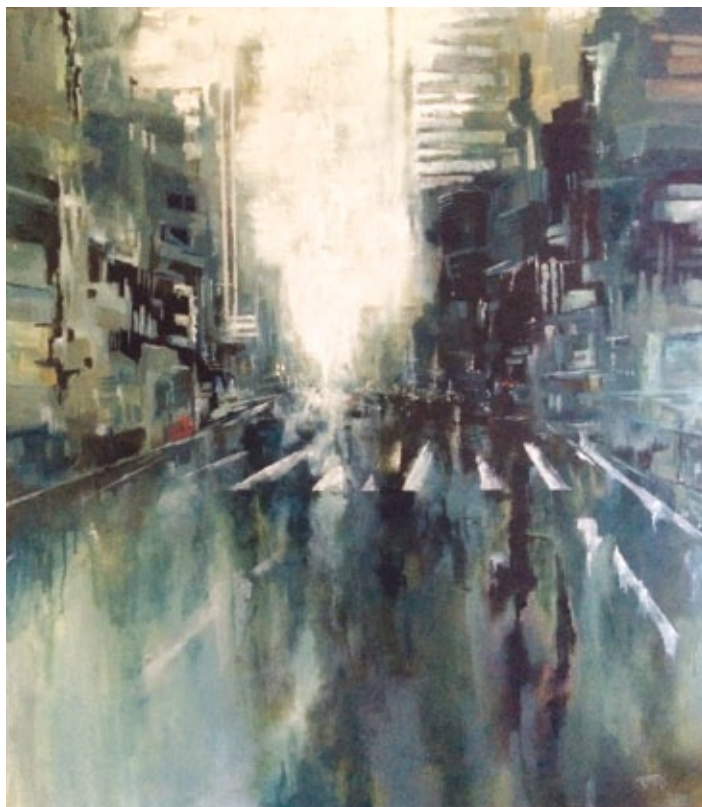
Paesaggio urbano olio su tela

Motivazioni: Una sintassi figurativa assai dinamica, a fronte di una tavolozza invece controllata, ben restituisce il senso di frenesia e l'impersonalità propri del paesaggio urbano rappresentato.