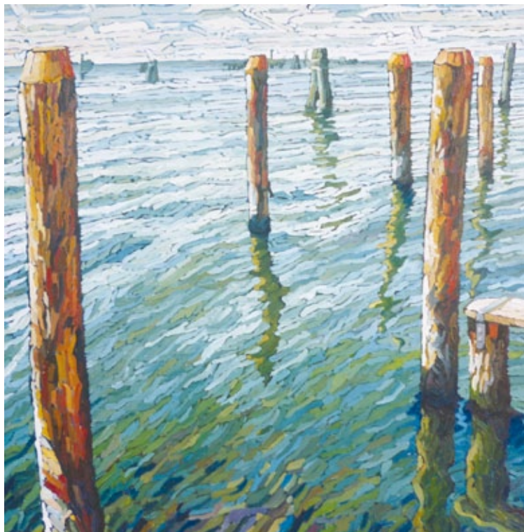
Le briccole di Pellestrina olio su tela

Motivazioni: La vibratilità cromatica dell'opera consente alla fruizione di avvalorarsi progressivamente; così, l'immagine statica sembra trasformarsi – grazie ai tocchi di spatola e ai contrasti simultanei – in un visibile cangiante, dinamico, flagrante.