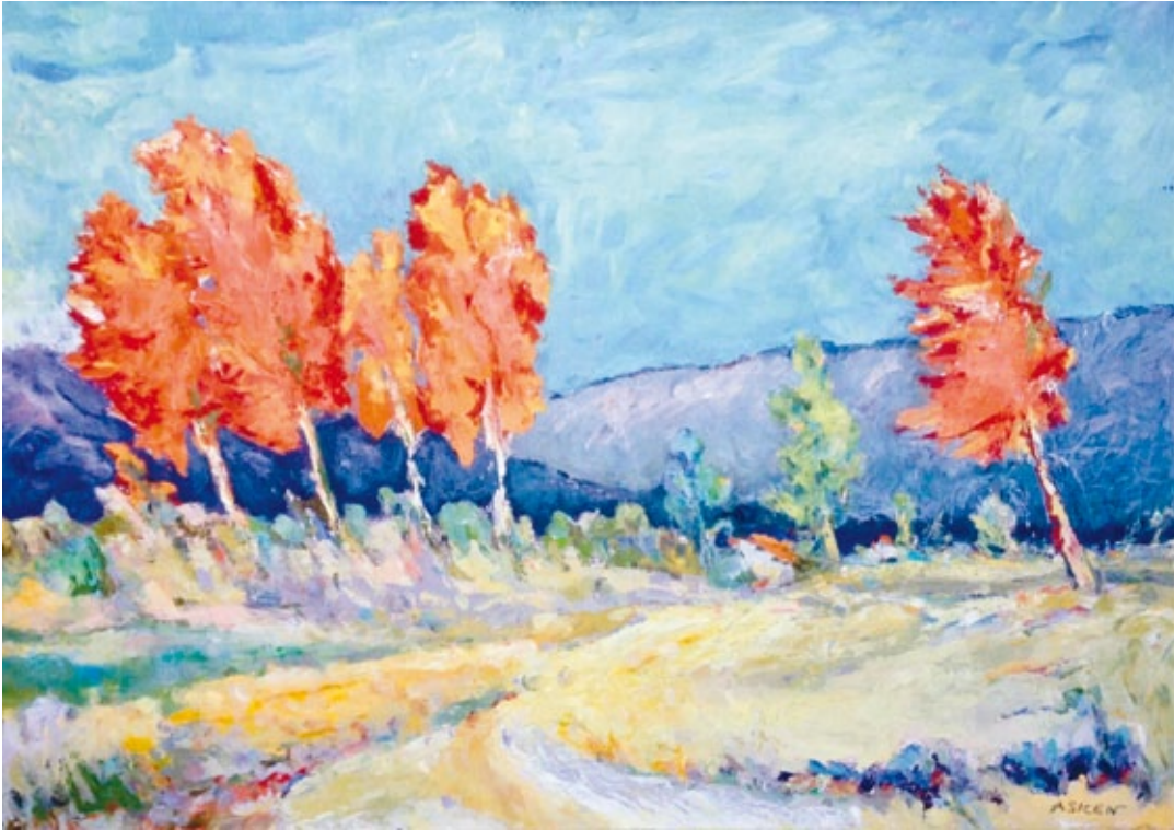
Autunno olio su tela