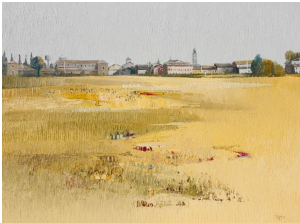
Autunno sulla bassa olio su tela