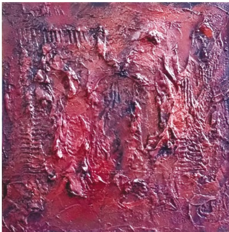
Anime imprigionate acrilico su tela