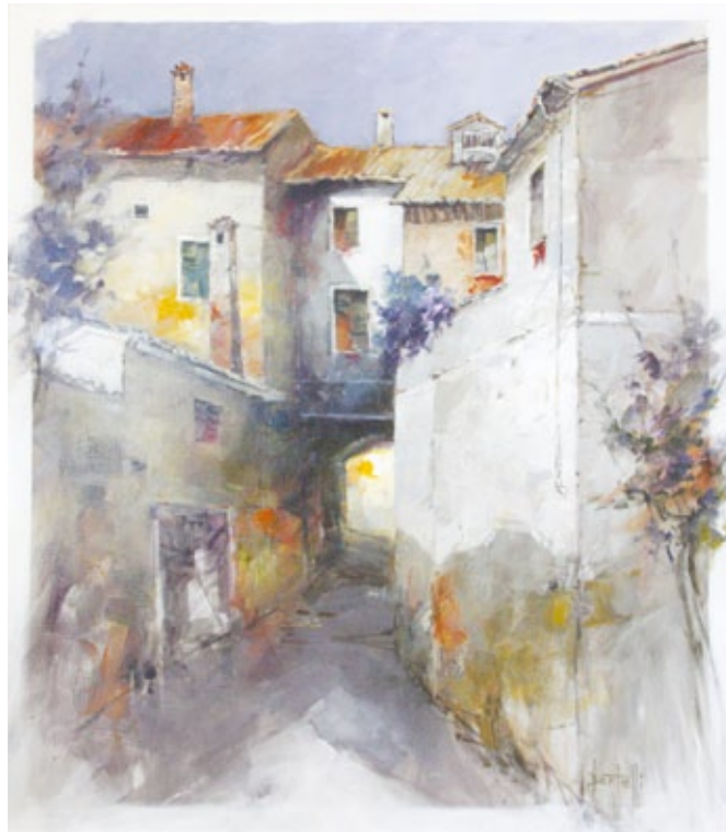
Atmosfera di fine estate acrilico su tela

Motivazioni: Stringendo l'obiettivo su un angolo pittoresco, il quadro vi concentra umori e sensazioni, con modi abili ed esiti squisiti.