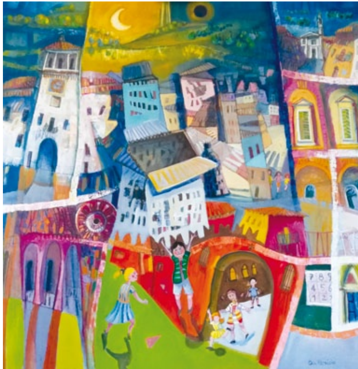
I bambini corrono nel Borgo Antico olio su tela