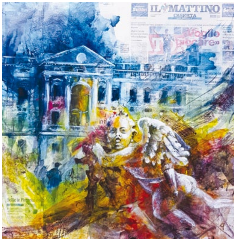
Visioni su Caserta mista su giornale