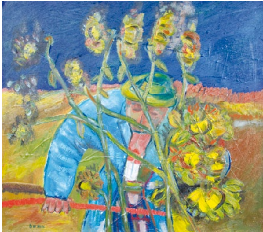
Contadino olio su tela