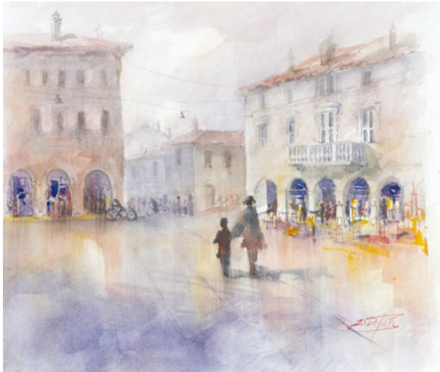
Luci nella piazza acquerello