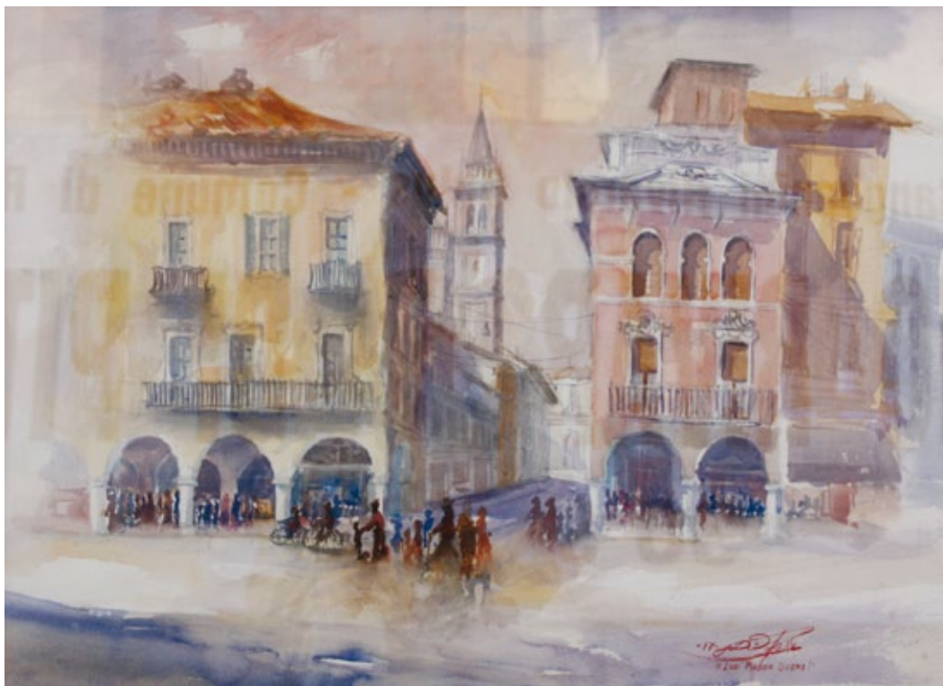
Lodi: Piazza Duomo acquerello