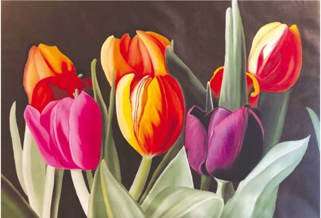
Tulipani olio su tela