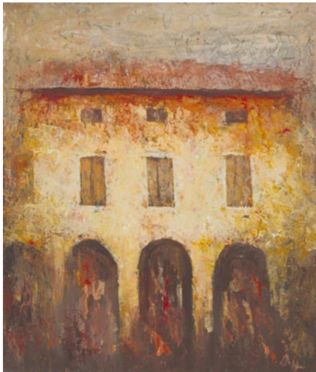
Senza titolo olio su tela