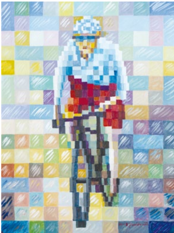
Il ciclista misto acrilico