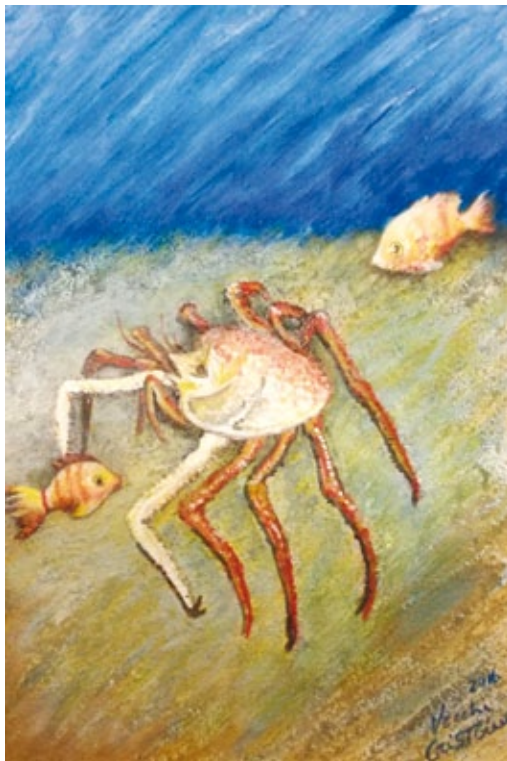
Il granchio 2016 acrilico materico su tela