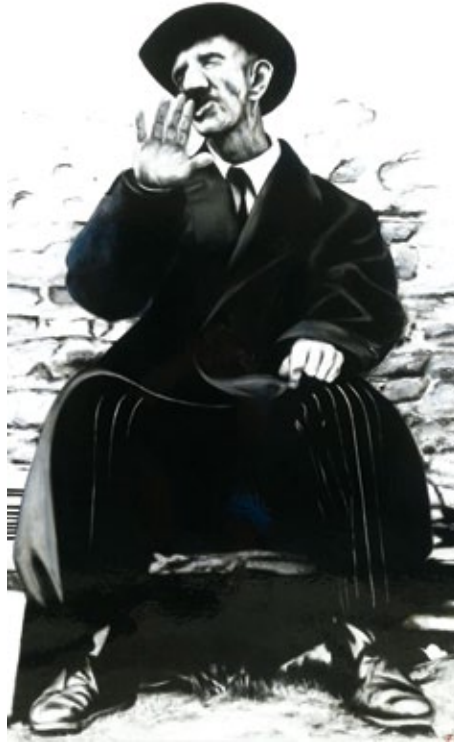
Antonio Ligabue olio su tela