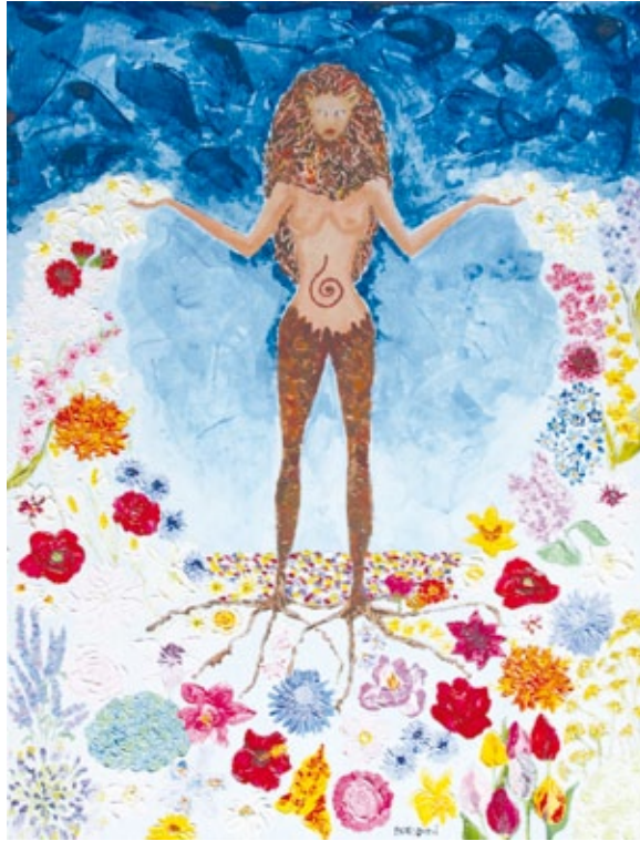
La condivisione istintiva dell'anima acrilico su tela