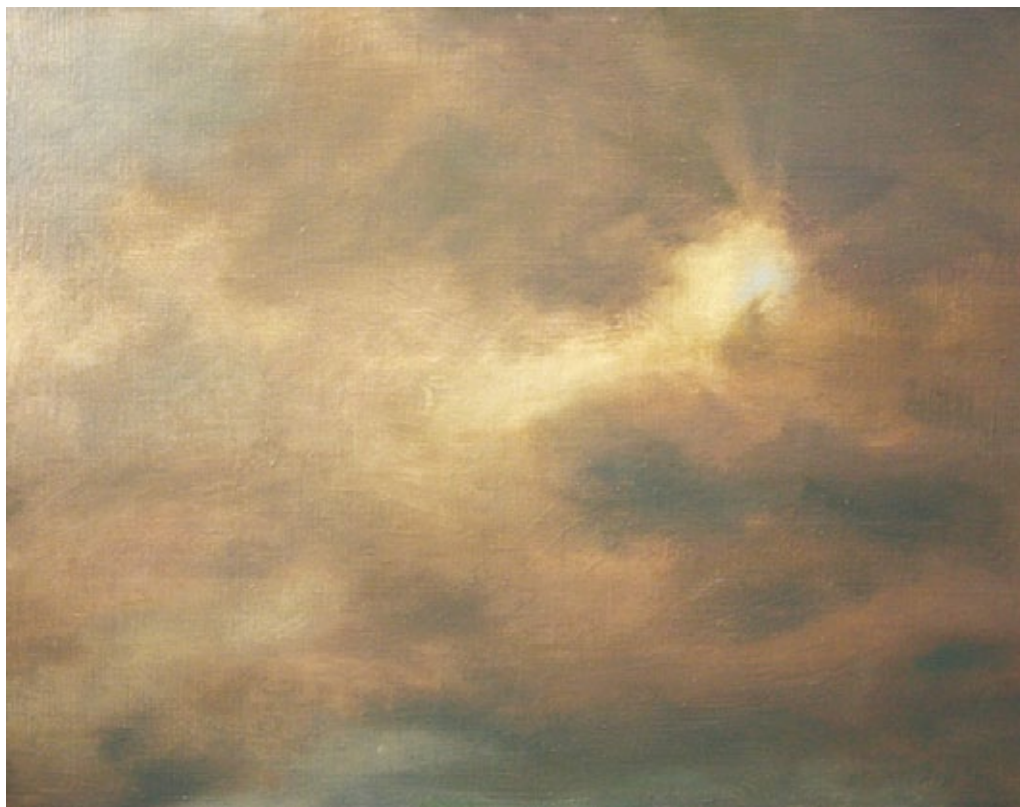
Winter Wine olio su tela

Motivazioni: L'obnubilamento nasconde l'esteriore eppure svela l'interiore: questo il coraggioso proposito dell'autore, che usa tanto le nuvole quanto lo spiraglio di sole per suggerire efficacemente analoghi stati d'animo.