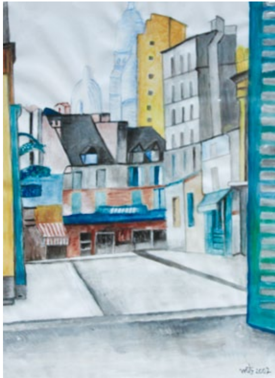
“Le sacre coeur”. Parigi anni ‘50 acquerello su carta