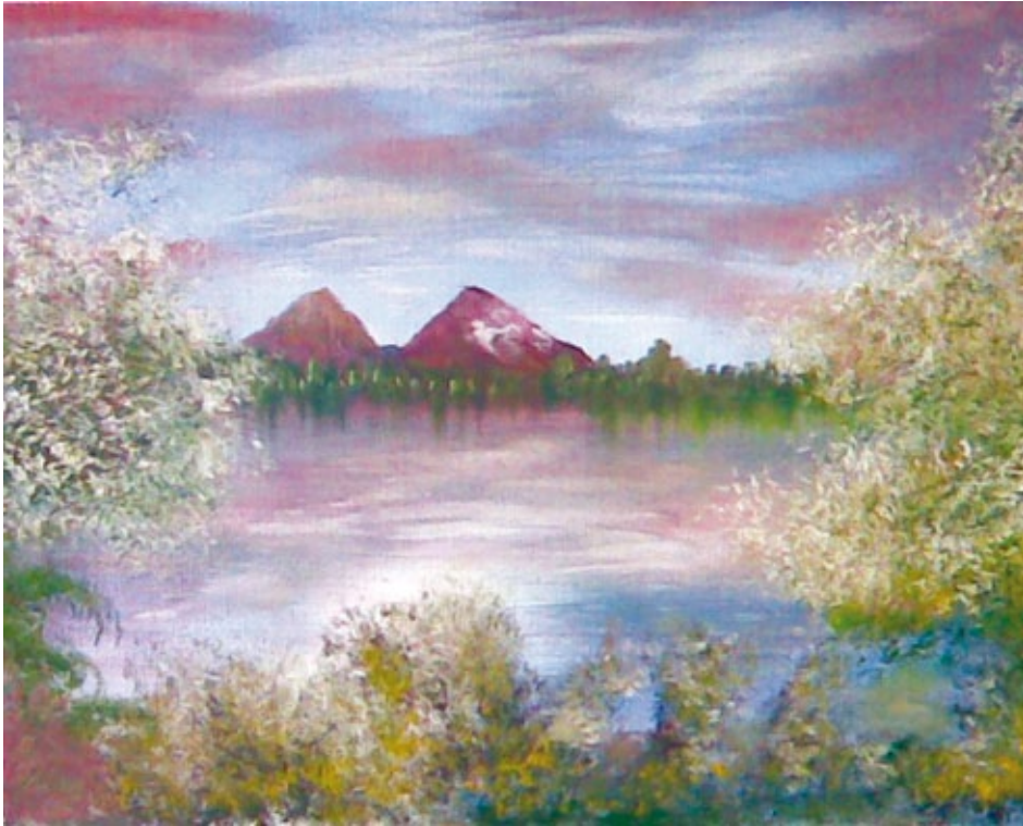
Mandorli in fiore olio su tela