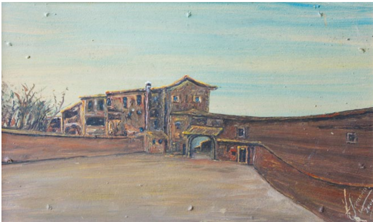
Paesaggio olio su masonite