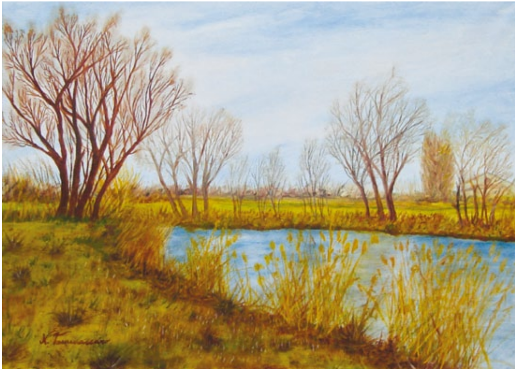
Ansa del Mincio olio su tela