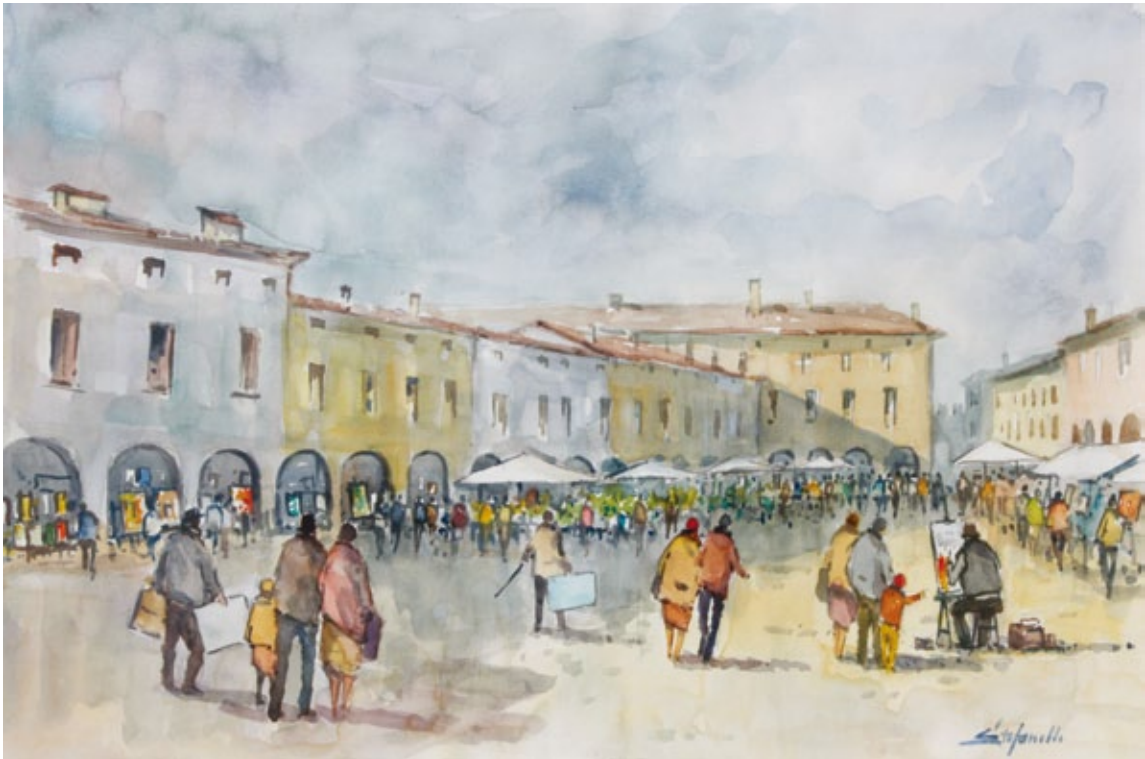
Scorcio di Rivarolo acquerello