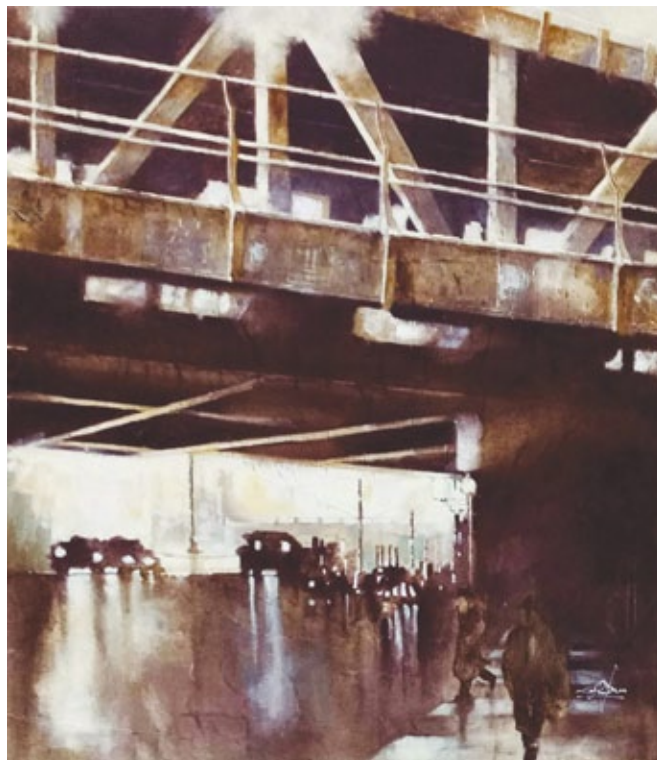
Ponte di Ferro. Sesto Calende