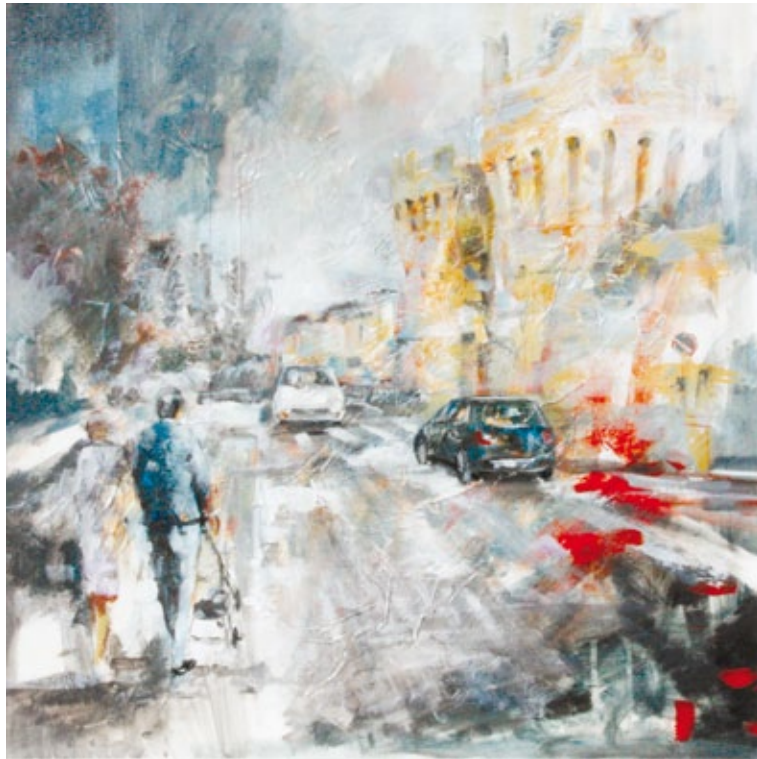
Sentori d'autunno a Rivarolo acrilico su tela