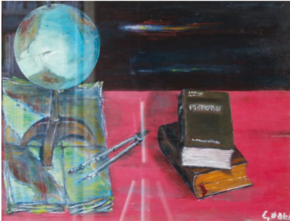
Scienza e ignoto olio su tavola