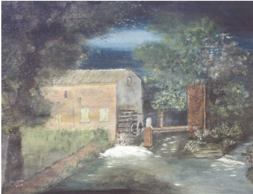
Molino della Pieve acrilico su tela