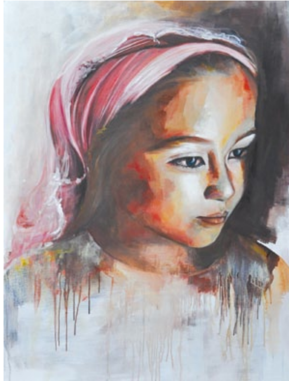
Senza titolo olio su tela