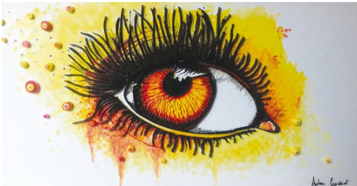
Ti sento acrilico e quilling