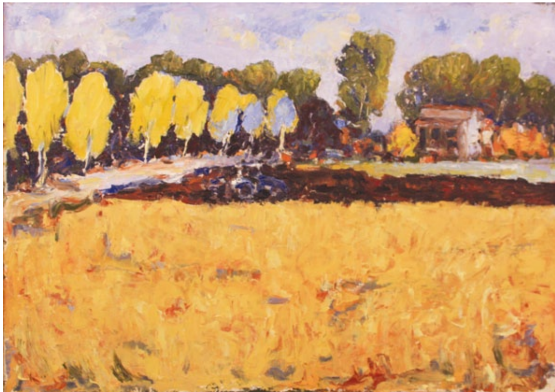
Campagna rivarolese olio su tavola

Motivazioni: La decisione di aprire al paesaggio agreste viene ulteriorizzata dal cromatismo acceso, teso ad esaltare con la gamma dei gialli la solarità della campagna estiva. Lo sguardo ne esce arricchito di un sentimento gioioso.