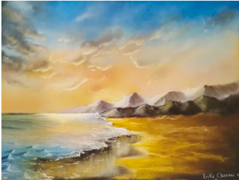
Il risveglio pastello su carta