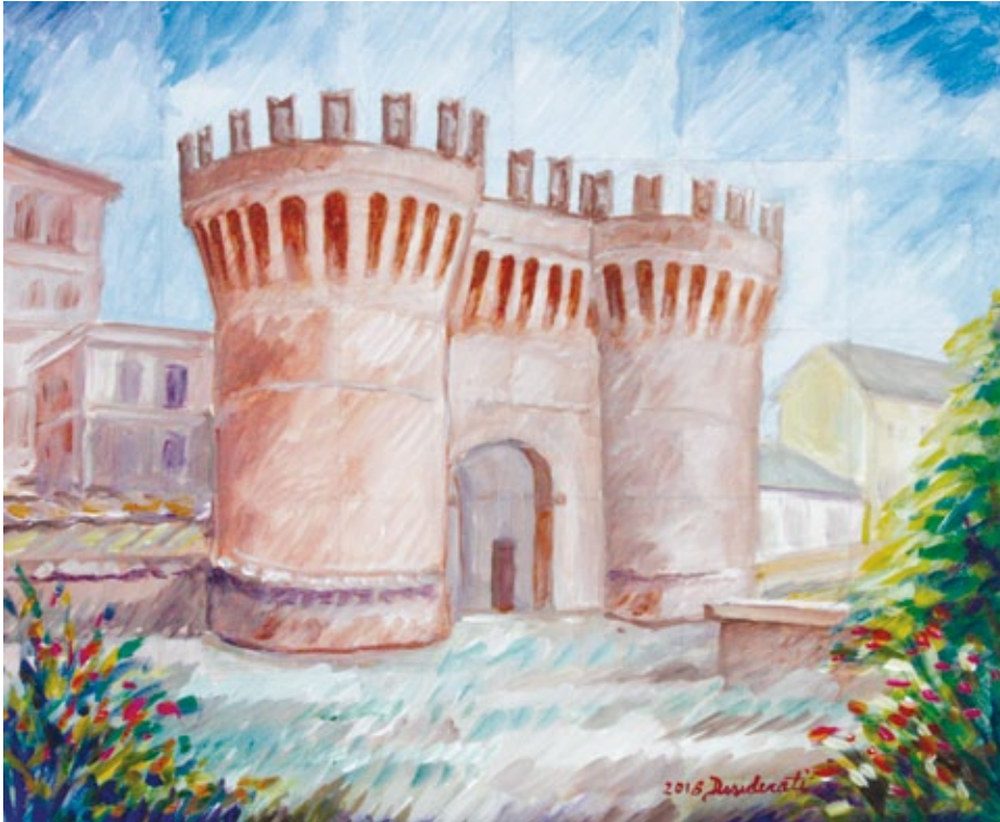
Porta Parma acrilico