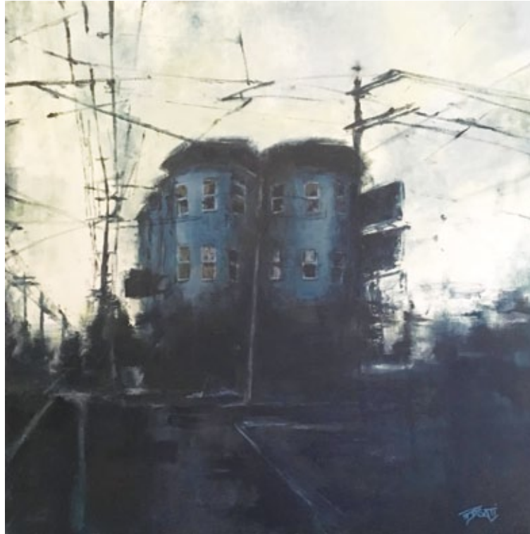
Tornando a casa olio su tela

Motivazioni: Il paesaggio urbano come crocevia di sentimenti: un soggetto tradizionale trattato con l'angoscia contemporanea che rende macchia oscura la realtà, una sorta di spazio concentratorio in controluce ove l'esteriore si rovescia nell'interiore.