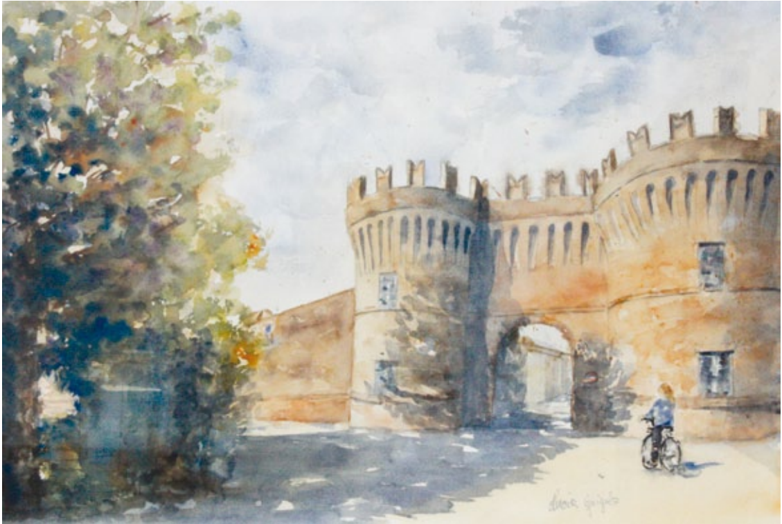
Porta Mantova acquerello