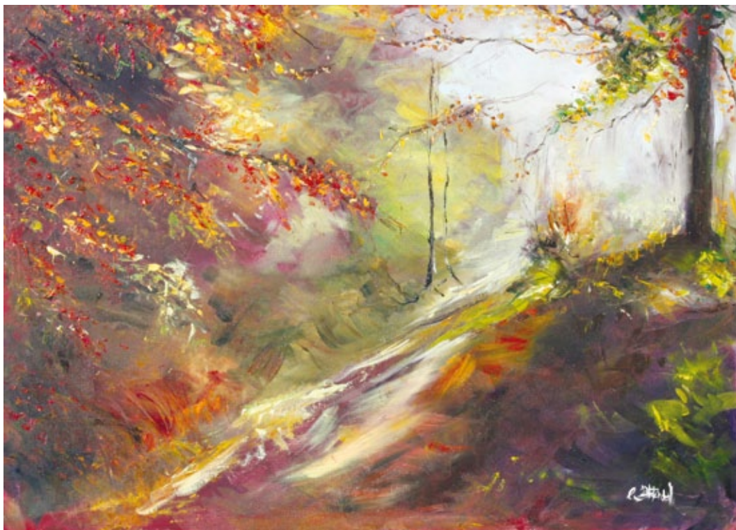
Campagna d'autunno olio su tela