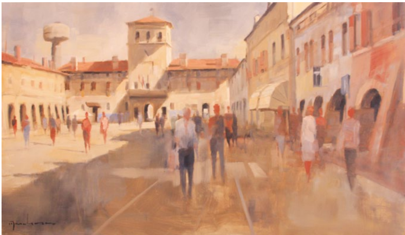
Piazza Finzi olio su tavola

Motivazioni: L'ampia veduta della piazza sa avvolgere lo spettatore, fino ad invitarlo in scena. L'attinuità cromatica sottolinea da un lato i dettagli quotidiani, dall'altro induce un sottile straniamento.