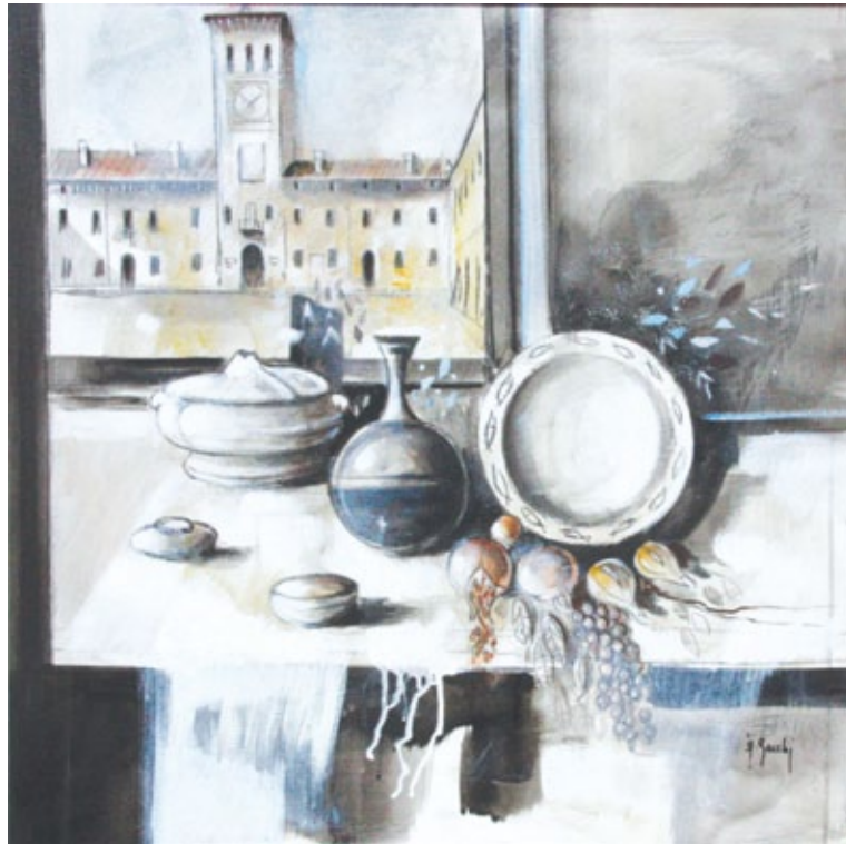
Rivarolo Mantovano visto dalla finestra tecnica mista di acrilico