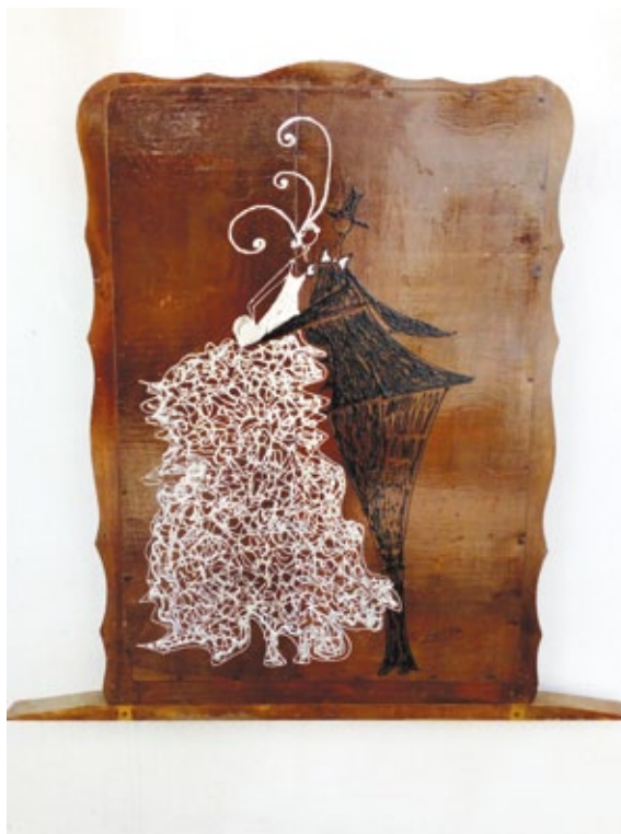
Sposi a Rivarolo acrilico su tavola