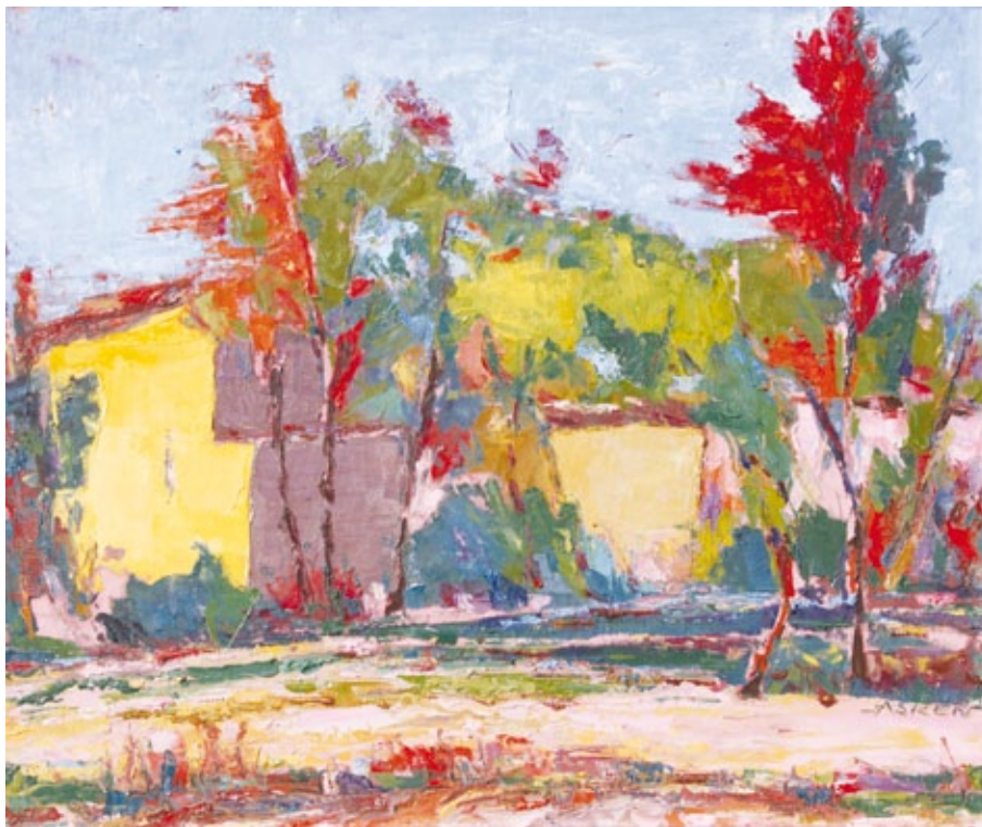
Autunno: periferia di Rivarolo olio su tela

Motivazioni: La vividezza dei colori ottiene l'accensione del paesaggio naturalistico che, in sottile connubio con l'abitato, esprime le gioie semplici dell'esistenza.