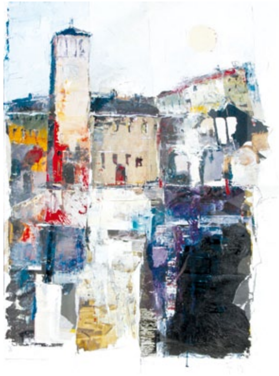
Dalla Piazza tecnica mista su tela