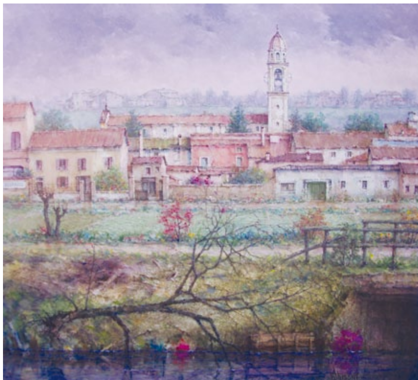
Paesaggio mantovano acrilico su tela