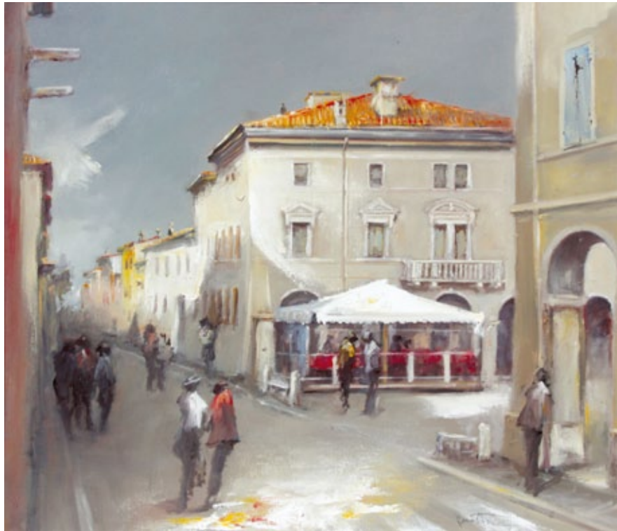
Presenze urbane a Rivarolo olio su tela