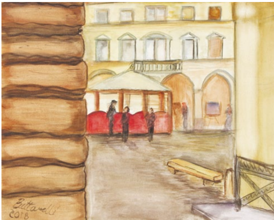
La panchina olio su tela