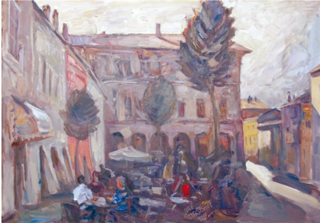
Piazza Finzi olio su tela