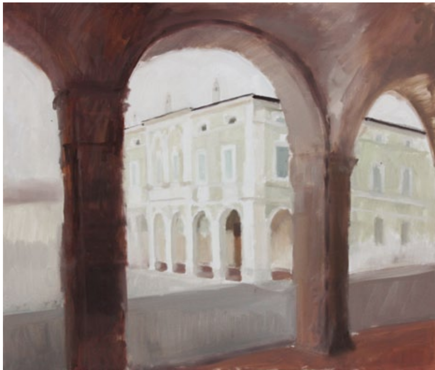
Rivarolo Mantovano olio su tela