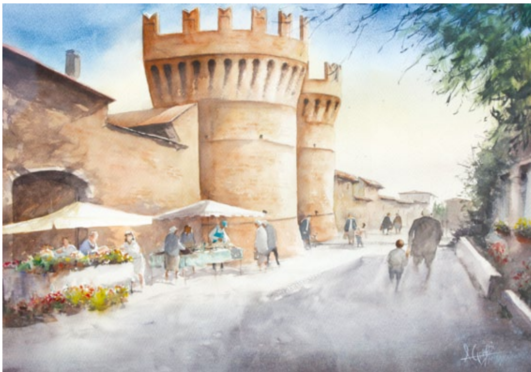
Mercato Porta Mantova acquerello