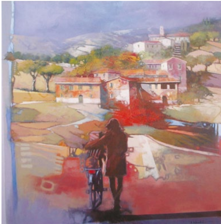
Ritorno al paese acrilico e olio su tela