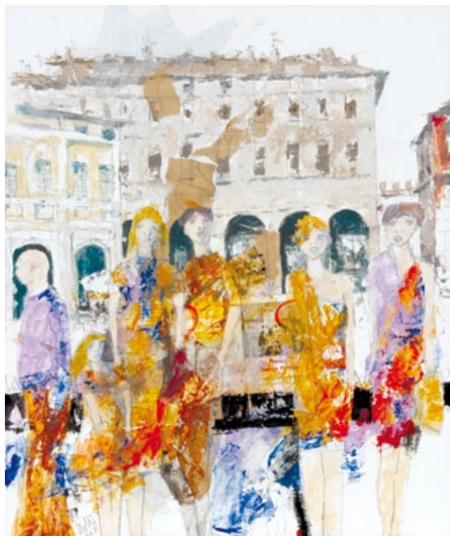
Il Premio a Rivarolo Mantovano tecnica mista