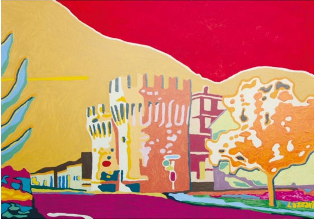
Porta Parma a Rivarolo smalto su tela e tavola