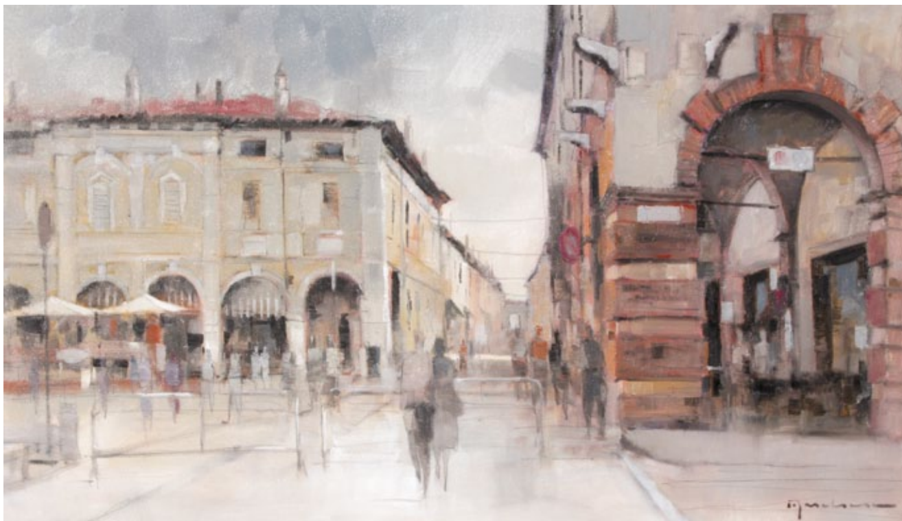
Rivarolo - Via Mazzini olio su tela

Motivazioni: Pur entro uno schema oleografico, l'opera restituisce con efficacia le coordinate dello spazio reale e insieme ne suggerisce l'intima abitabilità.