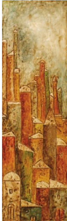
Ipotetica città tecnica mista