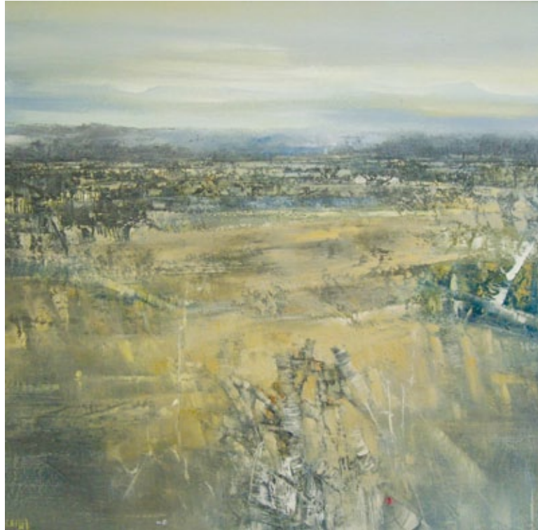
Memorie tecnica mista