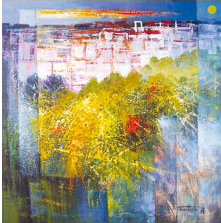
Oasi nella città acrilico su tela