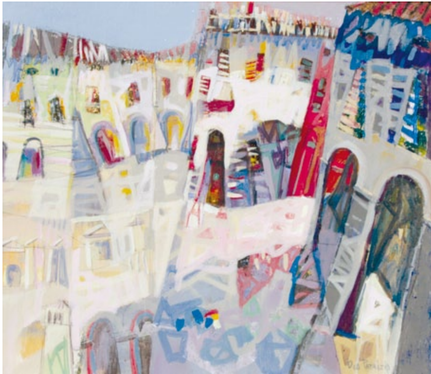
Colori del mattino nella piazza acrilico