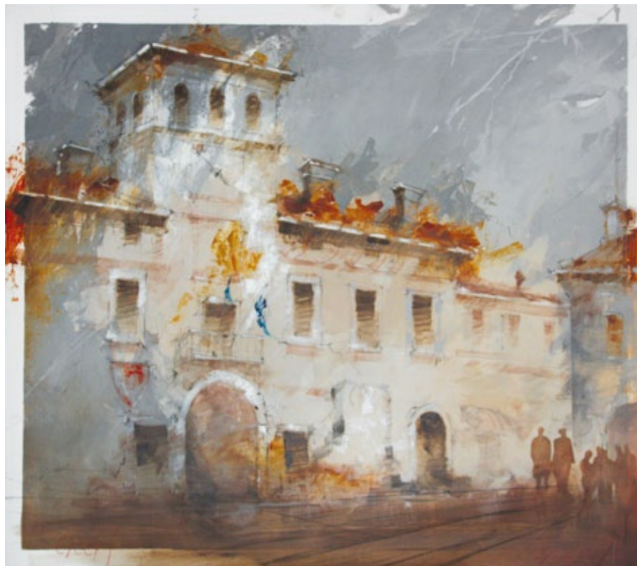
Rivarolo - La piazza olio su tavola

Motivazioni: Se risultano tradizionali il soggetto e il taglio, originale è invece la vibratilità del segno e del croma, nella zona in luce come in quella in cui la penombra conferisce una nota di malinconia.