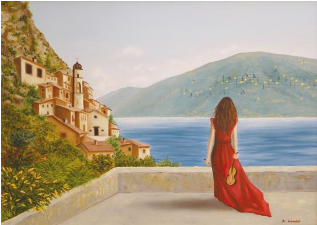
Limone sul Garda: armonia di immagini olio su tela