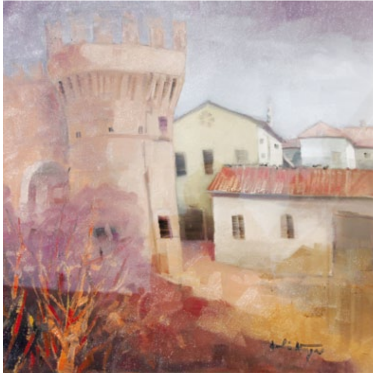
Autunno a Porta Parma olio su tela