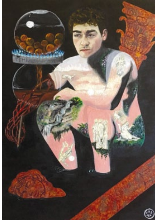
“Locus Amoenus”, allegoria dell’arte figurativa acrilico e olio su tela