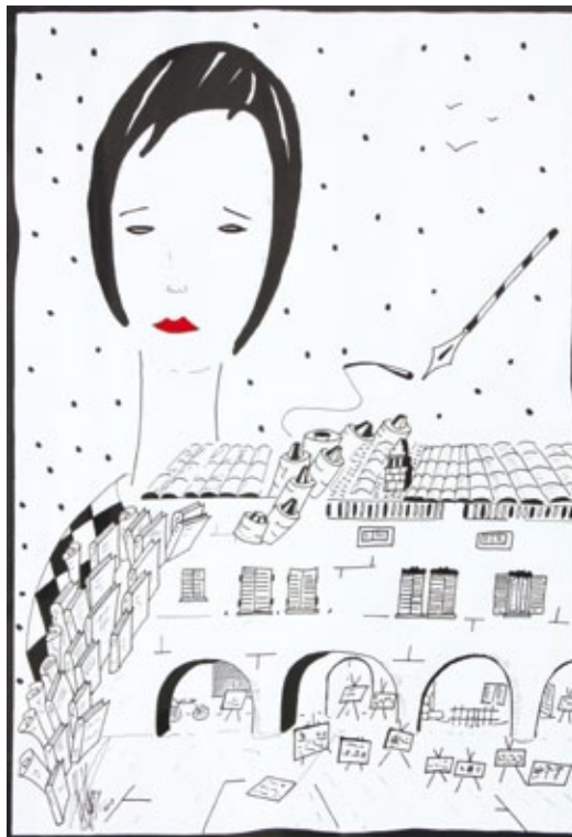
Portici Piazza Finzi tecnica mista