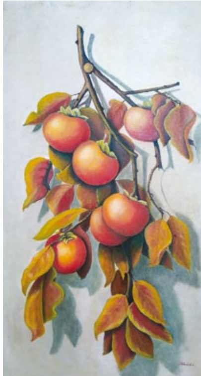
Frutto d'autunno olio su tela