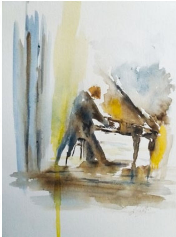
Omaggio a Boscaini acquerello