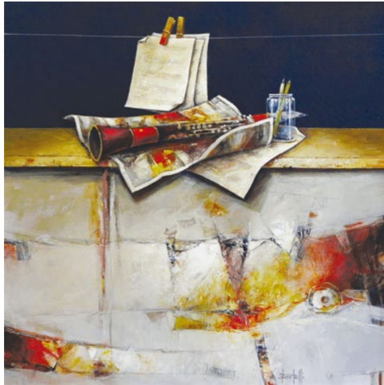
Musica mai scritta tecnica mista