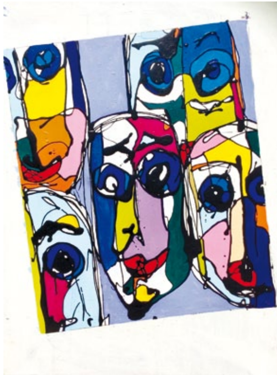
Selfie a Rivarolo misto acrilico smalto