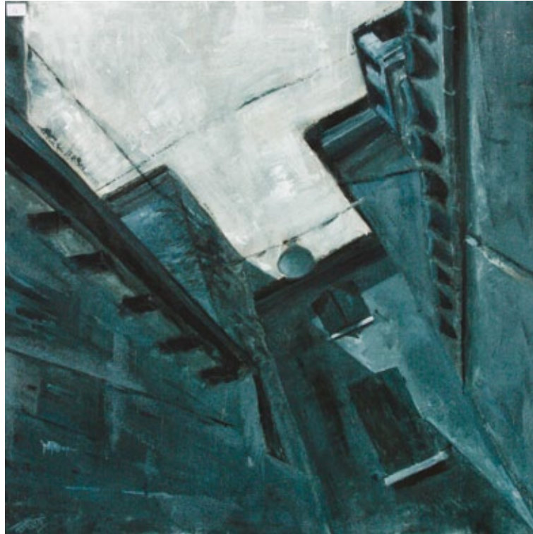
Via della Chiesa, dal basso tempera su tela