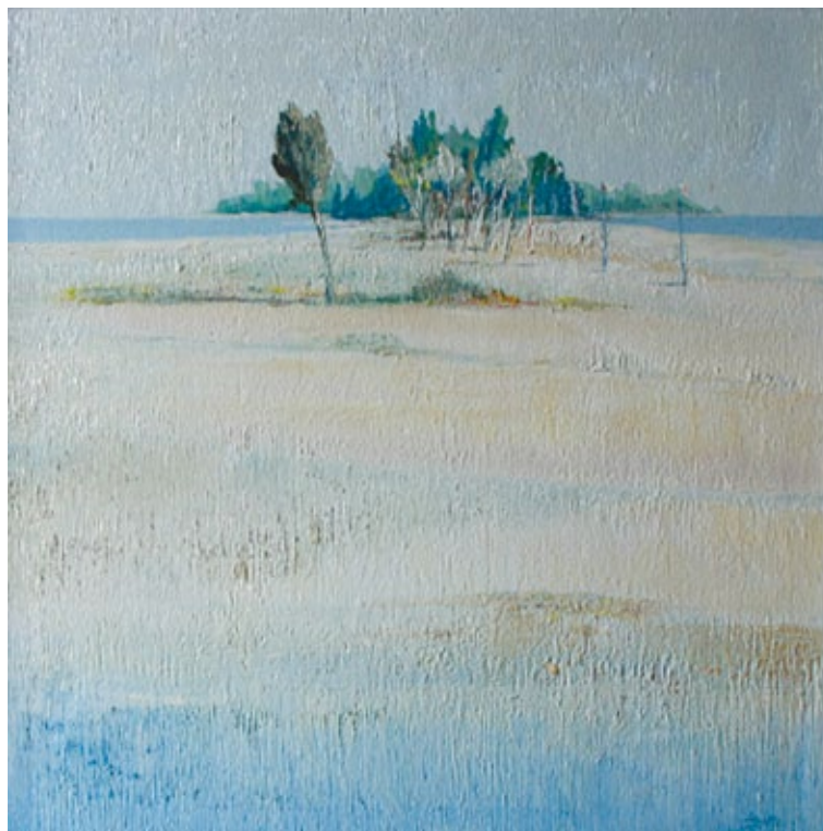
Atollo olio su tela